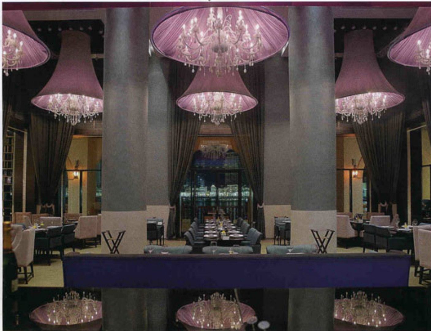
Le bac noir et lustré, occupe une place importante dans la salle. Il encadre la table centrale.